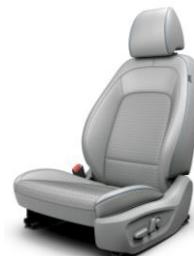
Pēc izvēles pelēkzils salons ar auduma-ādas sēdekļiem