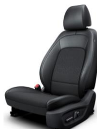
Stils: Sēdekļi ar melna auduma un ādas apdari