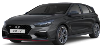
Micron Grey (Z3G) metāliska krāsa