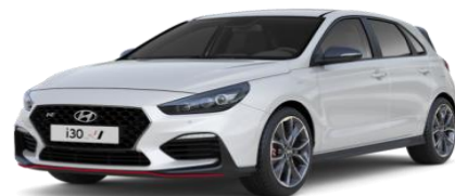
Polar White (PYW) pamatkrāsa