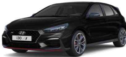
Phantom Black (PAE) perlamutra krāsa