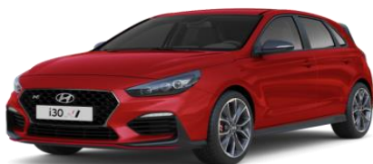
Engine Red (JHR) pamatkrāsa