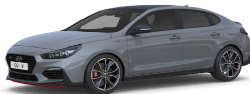
Shadow Grey (PYW) īpaša krāsa (pieejama tikai Fastback N modelim)