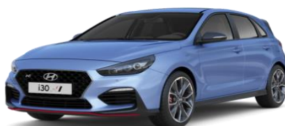
Performance Blue (XFB) īpaša krāsa