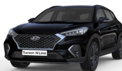
Phantom Black perlamutra krāsa