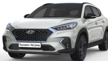
Polar White pamata krāsa