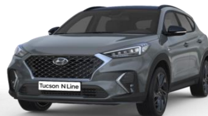
Shadow Gray īpaša krāsa