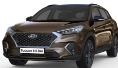
Moon Rock metāliskā krāsa