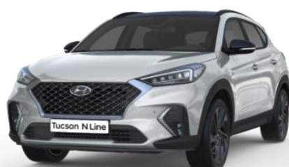
Platinum Silver perlamutra krāsa