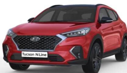
Fiery Red metāliskā krāsa