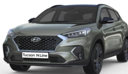
Olivine Grey metāliskā krāsa