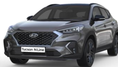
Micron Grey metāliskā krāsa