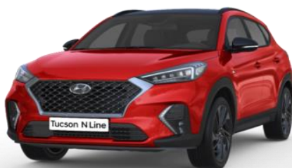
Engine Red pamata krāsa

Metāliska, īpašā vai perlamutra krāsa par papildu samaksu