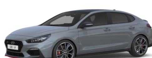
Shadow Grey īpaša krāsa (pieejama tikai Fastback N modelim)