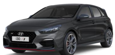
Micron Grey metāliska krāsa