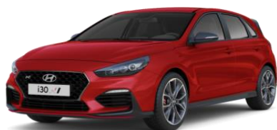
Engine Red pamatkrāsa