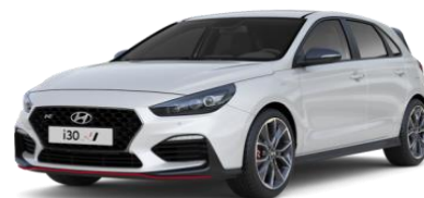
Polar White pamatkrāsa