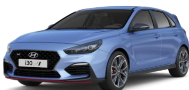
Performance Blue īpaša krāsa