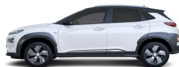
Comfort / Comfort Winner Edition