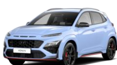
Performance Blue (SFB) Īpaša krāsa

Hyundai patur tiesības mainīt cenu un specifikācijas bez iepriekšēja brīdinājuma. Visiem attēliem ir informatīvs raksturs. Piegādāto automobiļu faktiskais aprīkojums un krāsu toni var atšķirties. Hyundai MotorBaltic Oy