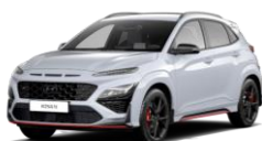
Sonic Blue (PYU) Īpaša krāsa